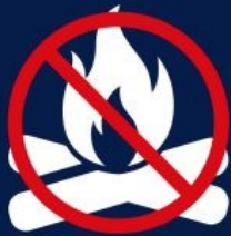
FEUX DE CAMP