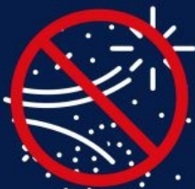
INSTRUMENTS PRODUISANT DES FLAMMÈCHES